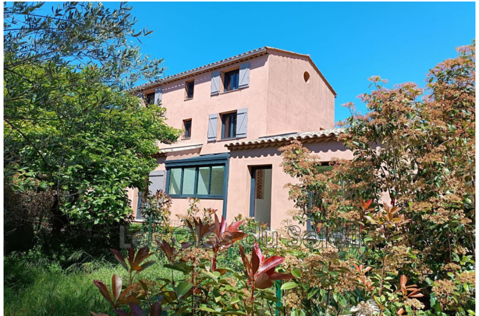
Villa 12925 Toulon

VENTE VILLA T7 Toulon La Serinette. Frais de notaires réduits. Située dans un quartier recherché et résidentiel, villa neuve de 2024 avec beaucoup de cachet offrant une surface habitable de 174 m 2 sur un terrain de 513 m 2 , au calme absolu en fond d'impasse. Au rez-de-chaussée un grand espace de vie de 60 m 2 avec cuisine semi-ouverte donne sur l'espace jardin et la piscine au Sud. Une suite parentale (avec dressing et salle d'eau), une buanderie et un wc complètent ce niveau. Au 1er étage, 2 chambres (dont une avec salle de bain privative) ainsi qu'une salle d'eau et wc. Au 2ème étage, 2 grandes chambres avec poutres apparentes et belle hauteur sous plafond, ainsi qu'une salle d'eau avec wc. Grâce à sa triple exposition (Est, Sud et Ouest), ses nombreuses ouvertures et baies vitrées cette maison familiale offre luminosité et confort de vie (climatisation réversible dans toutes les pièces). Le jardin propose plusieurs espaces aménagés autour de la piscine, à cela s'ajoute un appentis, un local piscine et 3 places de stationnements. Les commerces, écoles et plages du mourillon sont à proximité. Contactez Les Clés du Soleil Toulon Serinette au 04.94.46.27.27