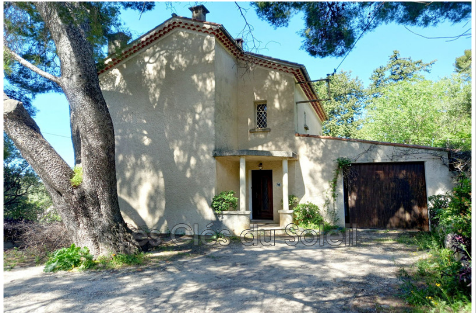
Maison 12906 Toulon

Les clés du soleil vous propose à la vente une maison individuelle d'environ 140m 2 sur un terrain de 1830m 2 dans le quartier très prisé de Notre Dame des missions à proximité de la corniche du Faron à Toulon. Elle est actuellement composée au rez-de-chaussée d'une chambre, un salon avec accès sur une terrasse, une cuisine indépendante et une salle d'eau. A l'étage 4 chambres avec balcon et une salle d'eau. Au niveau N-1 un sous-sol d'environ 50m 2 peut être aménagé en appartement indépendant. Un grand garage fermé et plusieurs places de parking complète ce bien. Cette maison se situe au plus grand calme dans un écrin de verdure préservé au fil des ans. Prévoir une rénovation complète de la maison...Possibilité d'extension de 130m 2 ..... Tél: 07 64 11 60 78